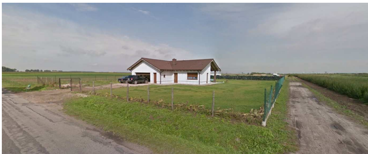
Pojedyncza zabudowa jednorodzinna w zachodniej części analizowanego terenu