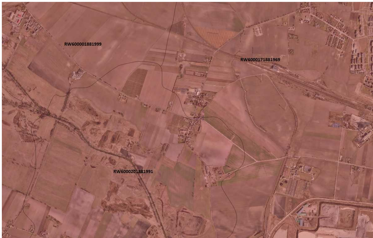
JCWP w okolicy analizowanego obszaru

Zgodnie z mapą korytarzy ekologicznych w Polsce ( http://mapa.korytarze.pl/ ) przez teren obszaru opracowania nie przebiega żaden korytarz ekologiczny. Korytarz ekologiczny to obszar umożliwiający migrację roślin, zwierząt lub grzybów. Korytarze ekologiczne są ważnym elementem sieci Natura 2000, gdyż umożliwiają przemieszczanie się organizmów między siedliskami. Na skutek działalności człowieka niegdyś rozległe siedliska zwierząt i roślin zostały rozdrobnione i często odizolowane od siebie. Istnienie tych terenów warunkuje prawidłowy rozwój gatunku, umożliwia znalezienie terytorium, ułatwia ucieczkę przed drapieżnikami. Szerokość korytarzy ekologicznych uzależniona jest od gatunku dla którego został wyznaczony, zasadniczo im większy gatunek tym szerszy korytarz. W zależności od gatunku, dla którego został stworzony korytarz powinien zapewniać jedną z potrzeb przemieszczania się zwierząt: