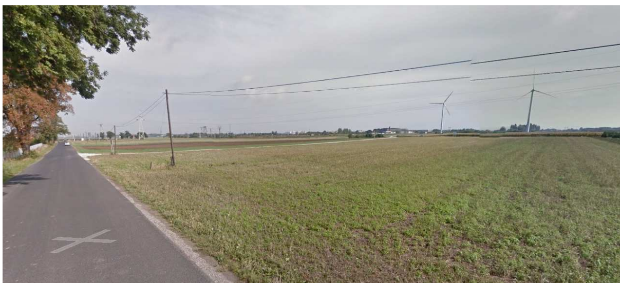
Pola uprawne – północny – wschód analizowanego obszaru