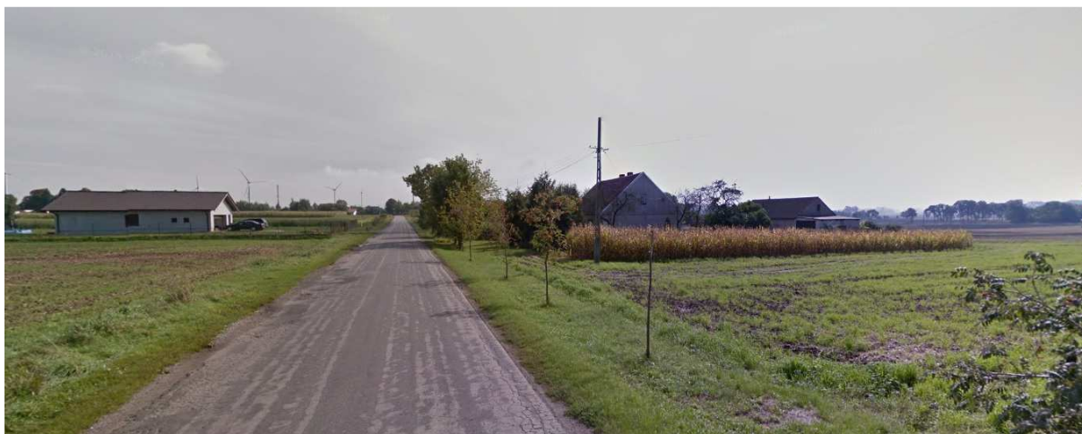
Widok z drogi powiatowej – zachodnia część opracowanie – w kierunku centrum miejscowości