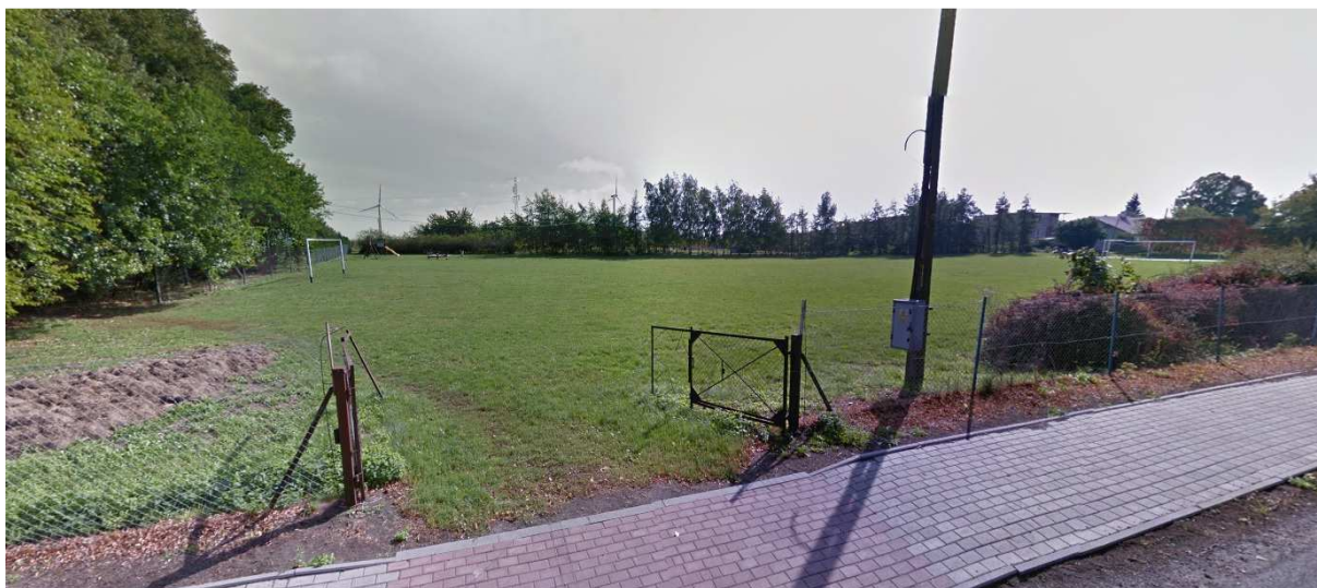
Plac sportowy w środkowej części analizowanego terenu