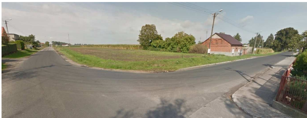
Skrzyżowanie dróg – centrum terenu opracowania

rolnicze, tereny zurbanizowane i przemysłowe. Aktualnie zabudowa na analizowanym terenie wprowadzana jest w sposób nieuporządkowany nie zachowany jest ład przestrzenny.