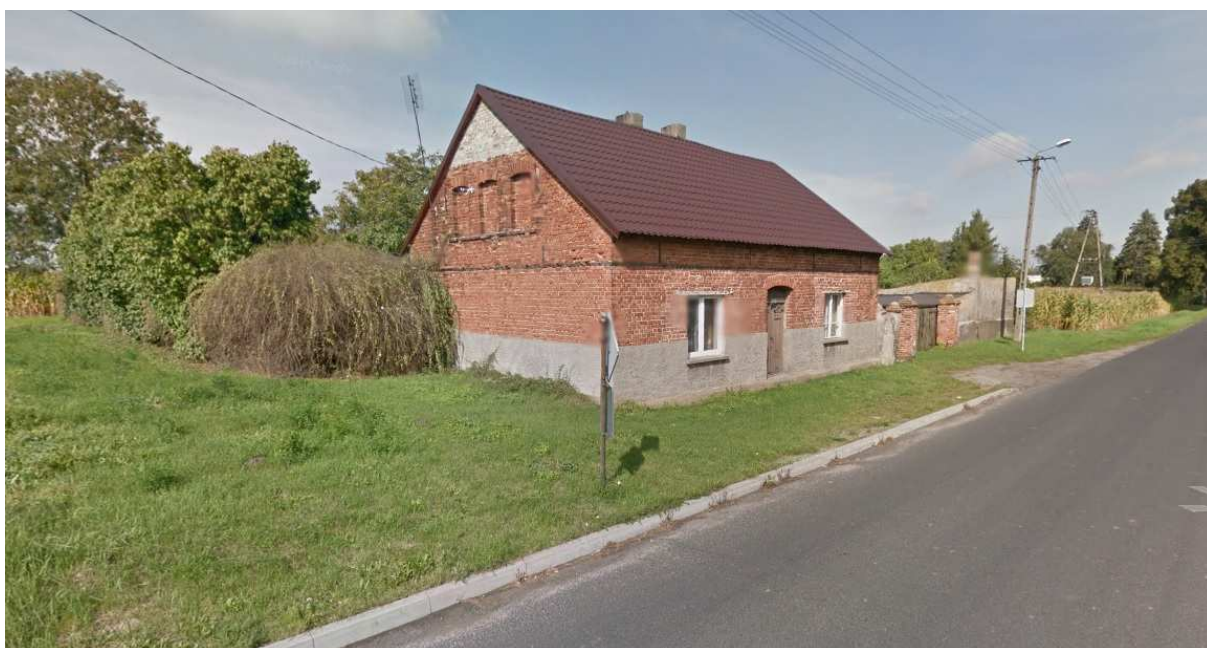
Starsza zabudowa jednorodzinna w centrum analizowanego terenu