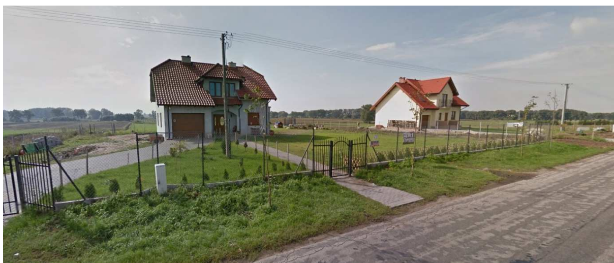
Zabudowa jednorodzinna w zachodniej części analizowanego terenu