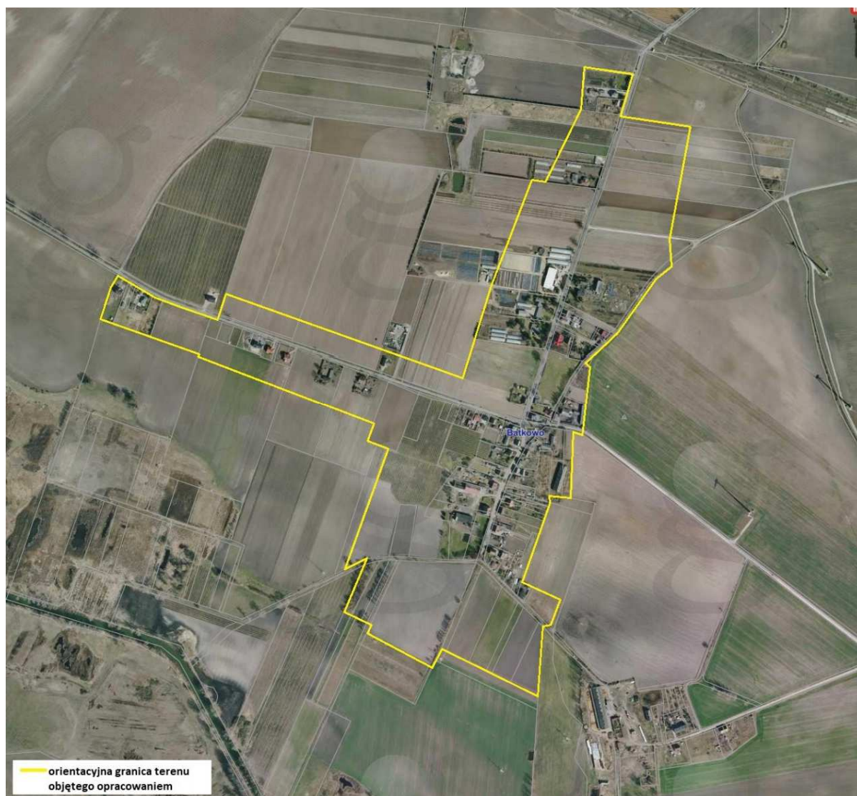
Charakter zagospodarowania analizowanego terenu