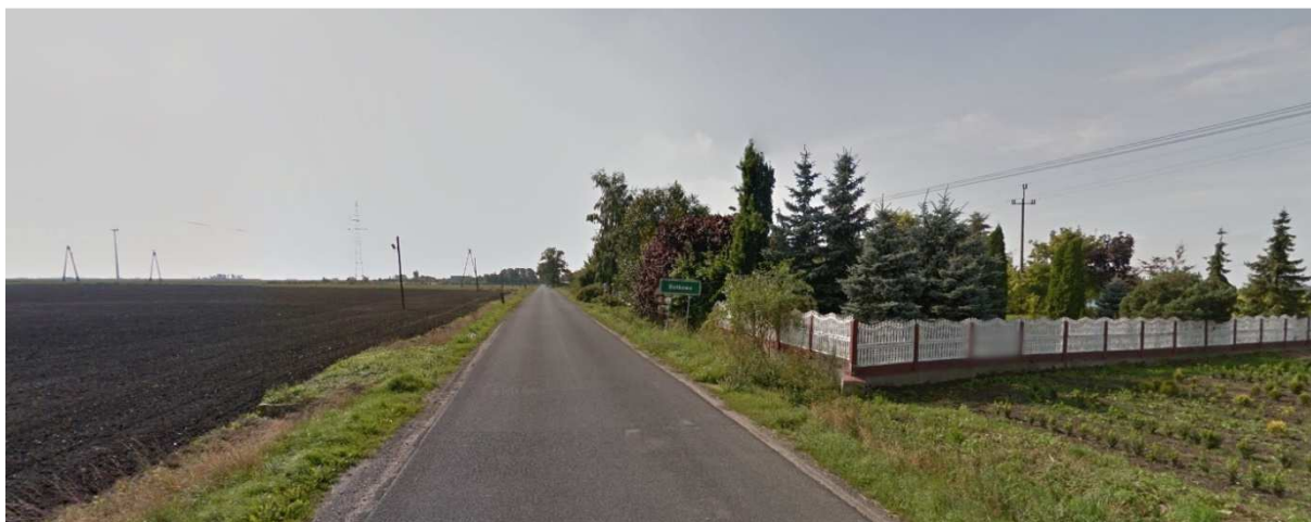
Widok w kierunku centrum miejscowości Batkowo, z północnego krańca analizowanego obszaru.